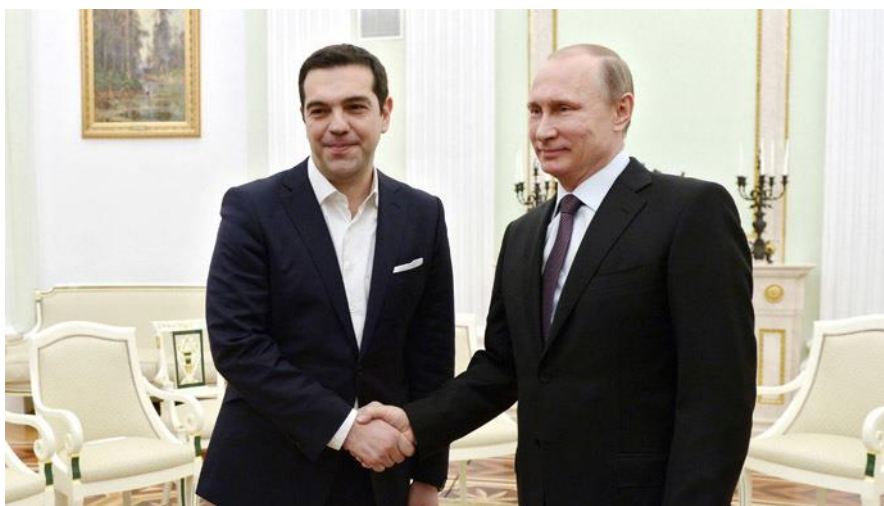
Den græske premierminister Alexis Tsipras møder den russiske præsident Vladimir Putin i Kreml, 8. april, midt i Grækenlands opgør med Den europæiske Union.

de euroen, snarere end at acceptere en svækkelse af budgetdisciplinen, og hermed euroens endeligt.